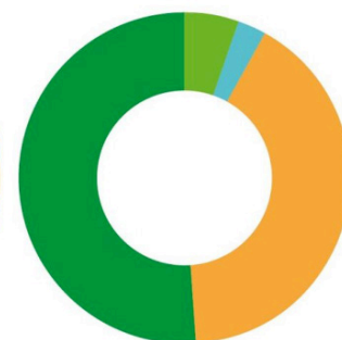
Den sålda elens ursprung